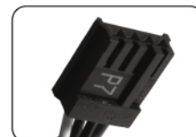
Разъем для дискового