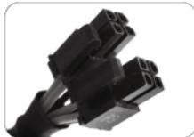
Разъем процессора (4+4 контакта)