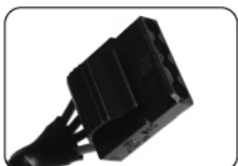
Разъем для периферийных устройств