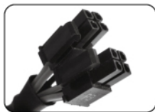
Connecteur CPU (4+4 broches)