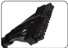
Разъем материнской платы ATX (24 контакта)