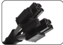
Connecteur CPU (4+4 broches)