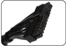
Connecteur de la carte mère ATX (24 broches)