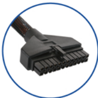
Cabezal de conexión a la alimentación principal de 24 pines

La instalación incorrecta de los conectores puede quemar la placa madre y otros componentes.