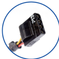
Cabezal de conexión para periféricos de 4 pines