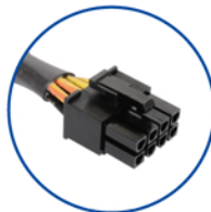
Cabezal de conexión para alimentación de la CPU ATX/EPS de 4+4 pines