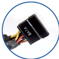
Cabeza de conexión S-ATA HDD