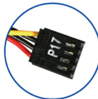
Cabeza de conexión FDD