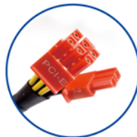
PCI-E 2.0, Cabeza de conexión de 6+2 pines